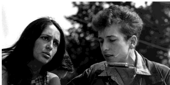
Bob Dylan e Joan Baez nel 1961

La sua è sempre stata una personalità fuori dagli schemi che ha cambiato la figura del cantautore contemporaneo e il modo di fare musica, dando maggior importanza all'espressione dell'interiorità e at-