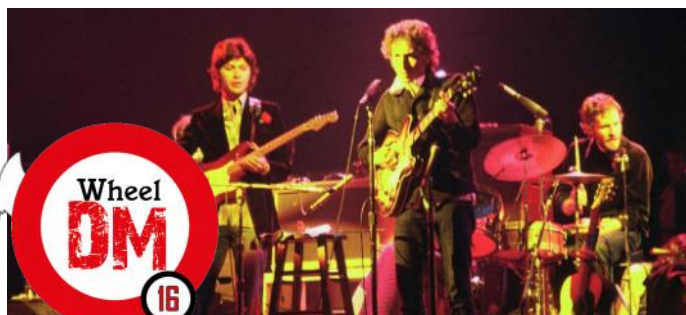
Bob Dylan and The Band, 1974