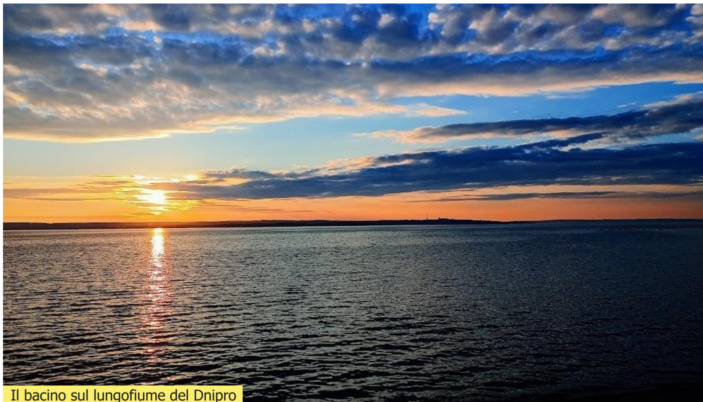
Il bacino sul lungofiume del Dniipro