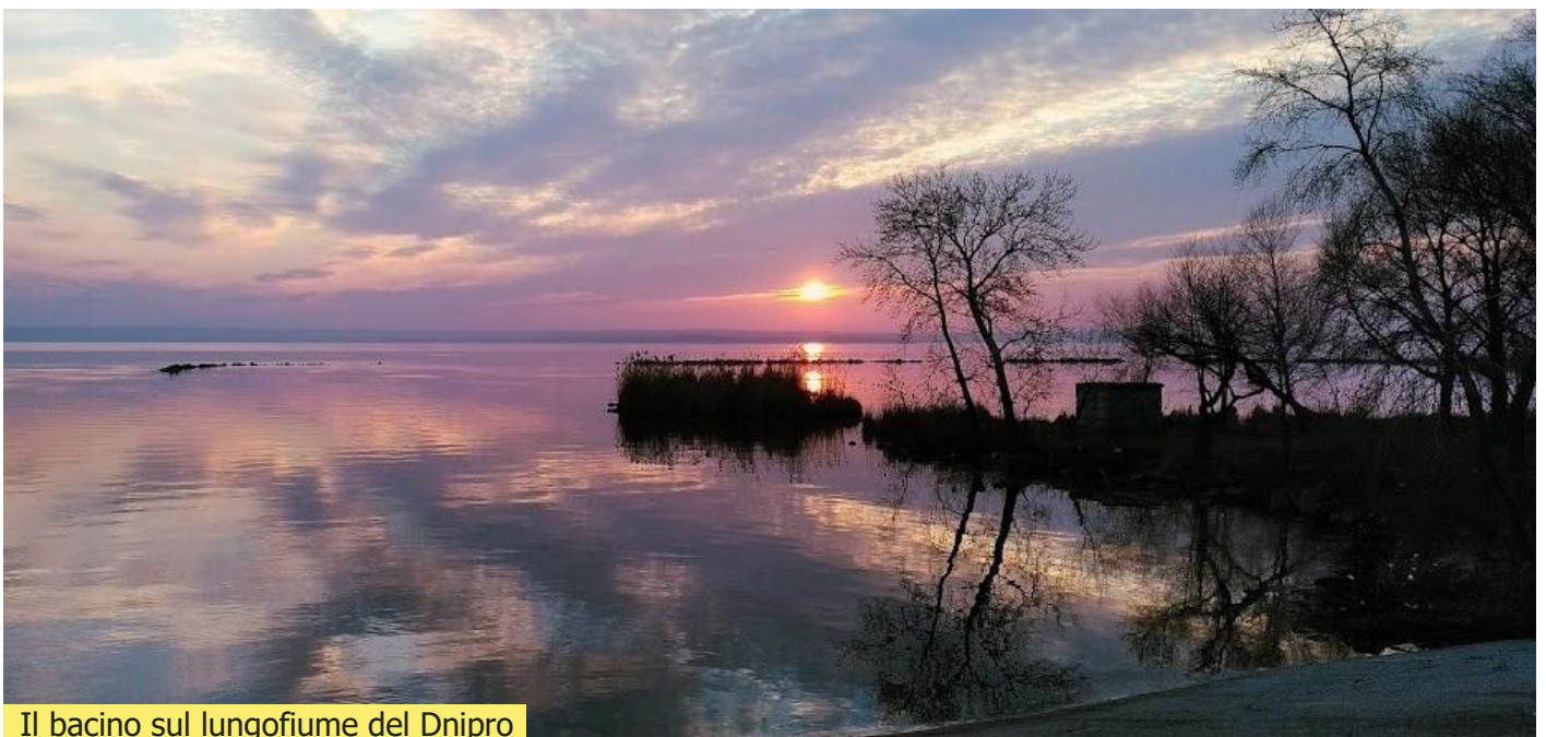
Il bacino sul lungofiume del Dnipro

Un saluto al macchinista e poi l'interminabile fila di vagoni.