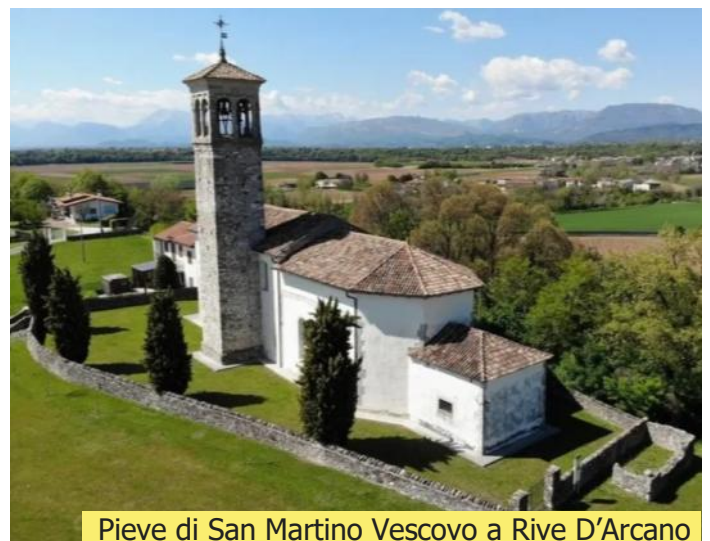
Pieve di San Martino Vescovo a Rive D'Arcano