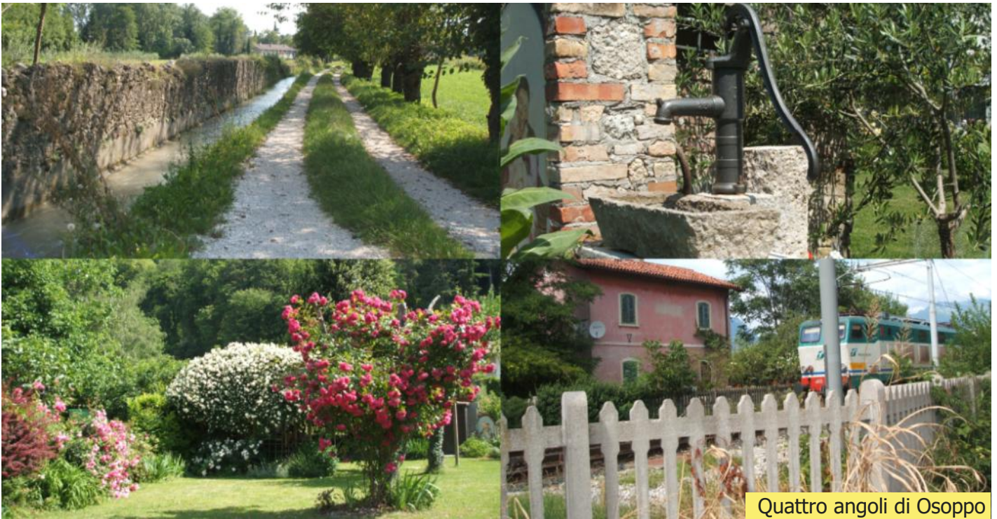
Quattro angoli di Osoppo

Il quarto è il giardino della vicina. In primavera è un caleidoscopio di colori. È bello muoversi tra i sentieri con rose, piante e fiori che ti sfiorano le braccia. Un pezzo di vecchio muro, una pompa, un piccolo capanno di legno, lanterne consumate dal tempo. Uccellini, farfalle, api, una cagnetta... e loro, i gatti. Quello timido che sbuca da un rosaio e va a nascondersi in quello vicino; quello sdraiato al sole che alza un po' il muso e sembra dirti "Ah, sei tu" e poi torna a dormire. Sono sufficienti pochi minuti, poi torno a casa accompagnato dal profumo della primavera.